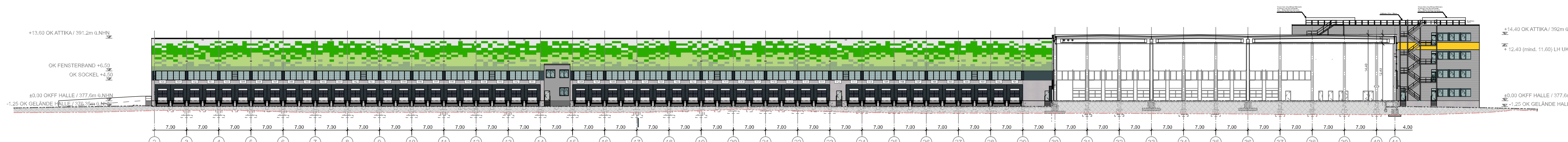
ANSICHT NORD "300er"