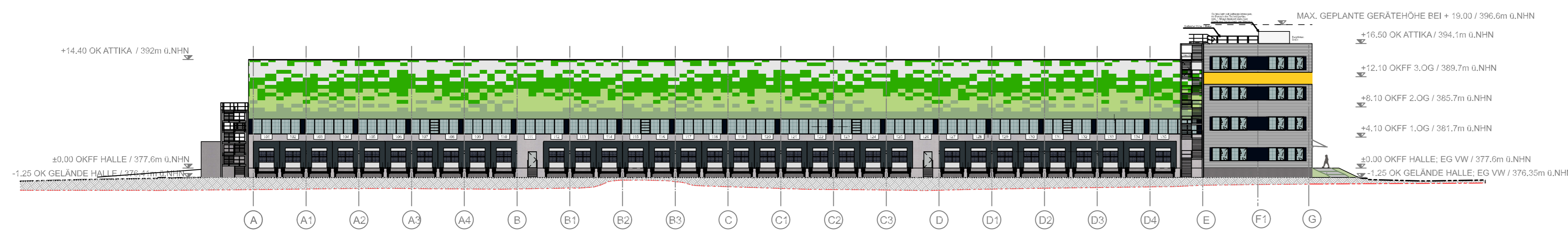
ANSICHT WEST "100er"