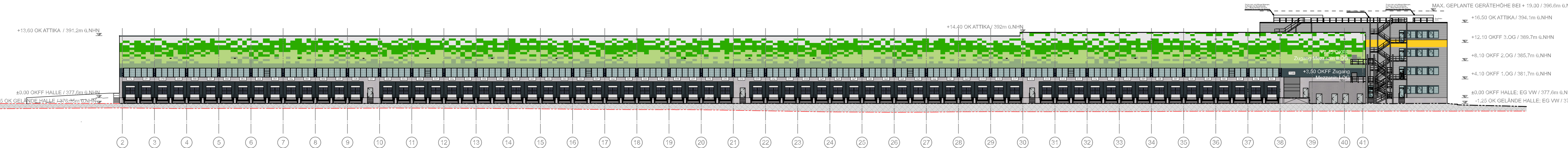
ANSICHT NORD "500er"